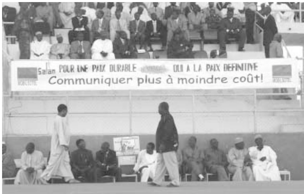
„Für einen dauerhaften Frieden – Mehr kommunizieren für weniger Geld“ Werbung eines Mobilfunkanbieters im Tschad.

Journalisten sind in ein komplexes soziales Gefüge eingebettet. Die Produkte journalistischer Arbeit entstehen unter vielfältigen sozialen, ökonomischen, normativen und kulturellen Einflüssen. Dieses System setzt der Autonomie des Akteurs Grenzen. Wer journalistische Arbeit konflikt sensibler gestalten möchte, sollte zwischen akteursbedingten und systembedingten Einflussfaktoren unterscheiden. Beide sind relevant für die Entstehung journalistischer Produkte.