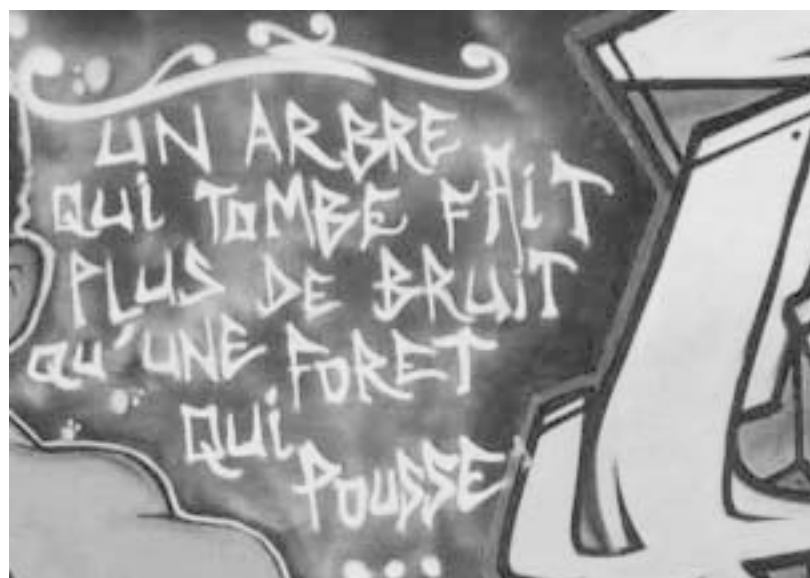
Graffiti an einer Pariser Hauswand (deutsche Übersetzung): „Wenn ein Baum fällt, dann macht das mehr Lärm als ein Wald, der wächst“ – Gewalt fasziniert, ihre Folgen sind einfach wahrnehmbar und zu beschreiben – sie hat Ereignischarakter. Friedensarbeit ist prozesshaft und es verlangt besondere Anstrengung, sie medial zu vermitteln.

bezeichneten, 100%-ig von Konfliktparteien gesteuerten und kontrollierten Medien verstanden. Vertreter solcher Medien gab es im Balkankrieg auf allen Seiten des Konflikts, Milles Collines in Ruanda gehört dazu, be-