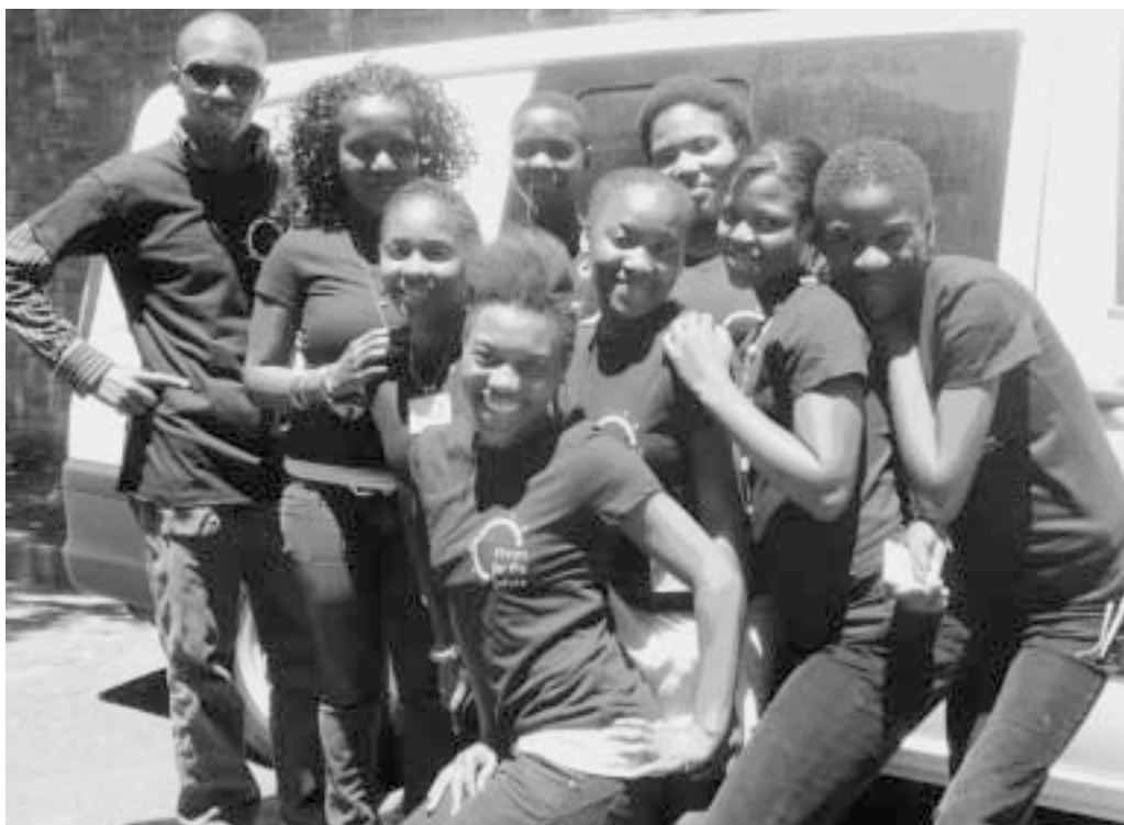
Medien machen Spaß – junge STEPS-FilmemacherInnen in Kapstadt

Das Programm schließt auch Peer Education ein. Die jungen FilmemacherInnen lernen, wie sie ihre Filme gezielt einsetzen können, um mit anderen jungen Menschen ins Gespräch zu kommen. Mit Unterstützung durch STEPS organisieren sie Film-