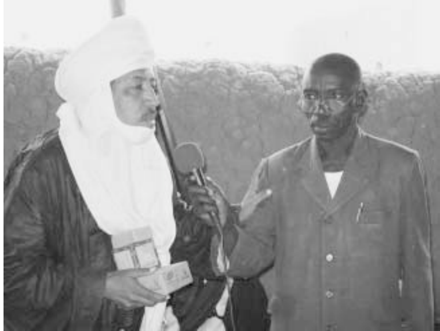
Radio erleichtert Kommunikation zwischen Kulturen, hier interviewt ein sesshafter Bauer einen Tuareg