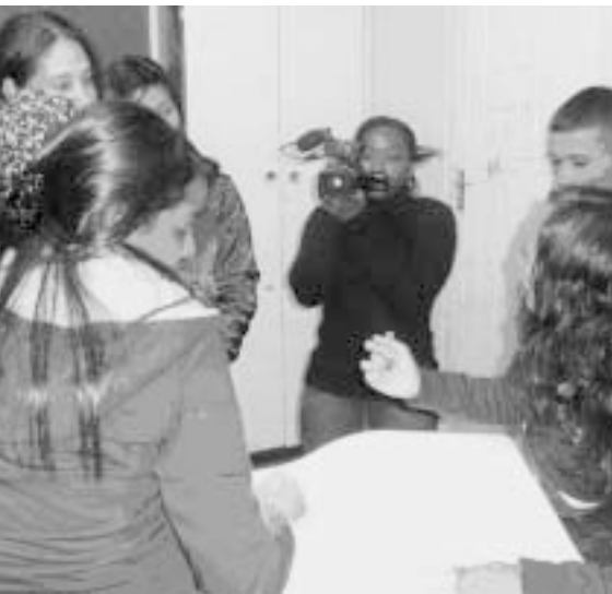
Gemeinsam wird das Filmscript entwickelt

AIDS. Teenager-Schwangerschaften sind ein großes Problem. Immer mehr Schülerinnen brechen deshalb ihre Schulausbildung frühzeitig ab. Dazu kommt noch die Gefahr der HIV-Übertragung. Sie wissen, dass es nicht leicht ist, darüber zu reden. Deshalb wollen sie mit ihrem Film die Schüler und Schülerinnen ermutigen, diese Probleme anzugehen und Verantwortung für ihr Leben zu übernehmen.