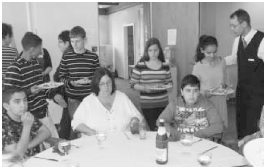
Viele hungrige Esser machten die Kochaktion zu einem großen Erfolg!

13 SchülerInnen der siebten Klassen der Berliner Kepler-Oberschule kochten und servierten das Mittagessen im Ausbildungsrestaurant der Berufsfachschule für Hotellerie & Gastronomie, Akademie Berlin-Schmöckwitz. Als Mittagsgast war anwesend Frau Petra Merkel, Vorsitzende des Haushaltsausschusses im Wahlkreis Charlottenburg-Wilmersdorf. „Wir erfahren immer wieder, z. B. durch Flüchtlingsströme, wie nah uns Afrika ist. Europa kann sich langfristig nicht von Afrika abschotten. Die eigenen Kompetenzen Afrikas müssen besonders durch die Förderung von Bildung gestärkt werden. Dafür steht auch das Projekt