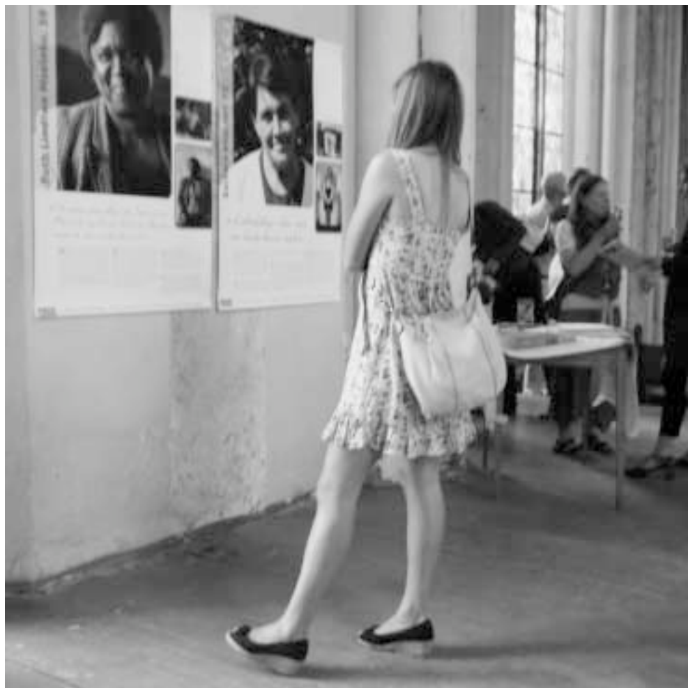
Lebenslinien interessieren jung und alt