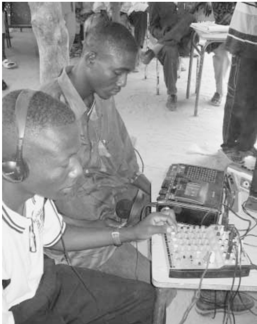
Radio lässt sich mit einfachsten technischen Mitteln machen.