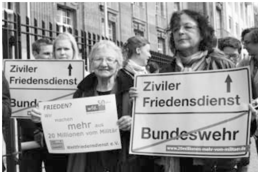
Aktion vor dem Verteidigungsministerium am 11. April 2011.

1,6 Billionen Euro betragen nach Angaben des Friedensforschungsinstituts SIPRI die globalen Militärausgaben im Jahr 2010 ( www.sipri.org/media/presreleases/milex ). Angesichts dieser unvorstellbaren Summe erscheint es unverständlich, dass so wenig in den Frieden investiert wird. Deutschland gibt für Militär über 30 Mal mehr aus, als für zivile Konfliktbearbeitung. Bei den Friedensprogrammen wurde sogar gekürzt. Wir fordern 20 Millionen Euro mehr für den Zivilen Friedensdienst. Für die Bundeswehr ist das nicht viel. 20 Millionen kostet der deutsche Afghanistaneinsatz in nur