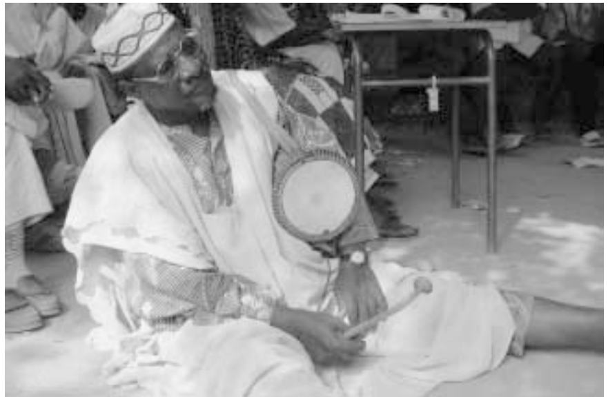
Märchenerzähler, Sänger, Chronist – der Griot vereint alle diese Rollen in sich und ist aus westafrikanischen Kulturen nicht wegzudenken.