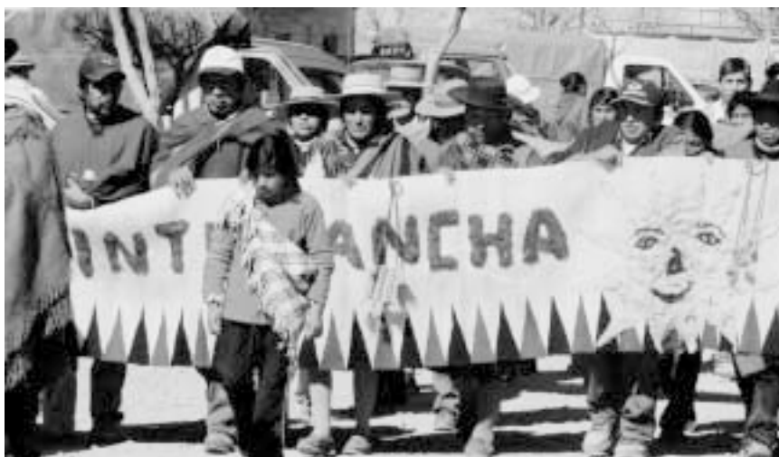
Unterstützende Menschenrechtsarbeit schafft Selbstbewusstsein und ermutigt zur Pflege von Traditionen – Indigene bei einem Festumzug

( www.conflictosmineros.net , http://opsur.wordpress.com , www.noalamina.org )