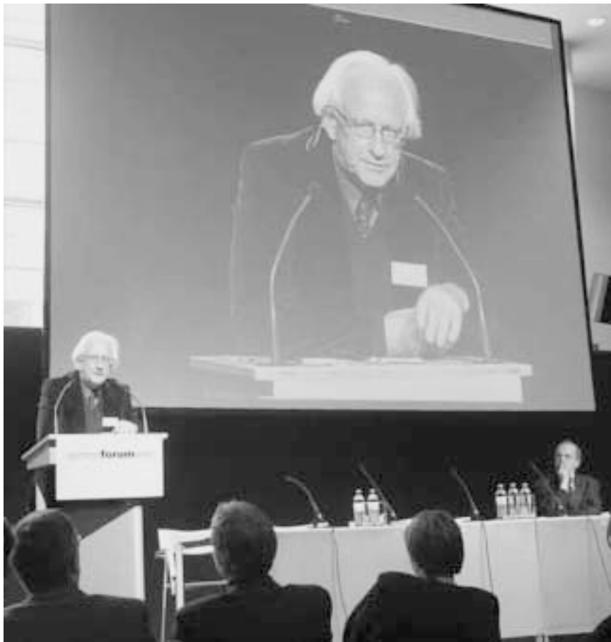
Auch ein Beispiel von Medienmacht. Der norwegische Friedensforscher Johan Galtung bei einem Vortrag in Wien als doppelter Johan: in Natura und als Projektion – wer ist eindrucksvoller?