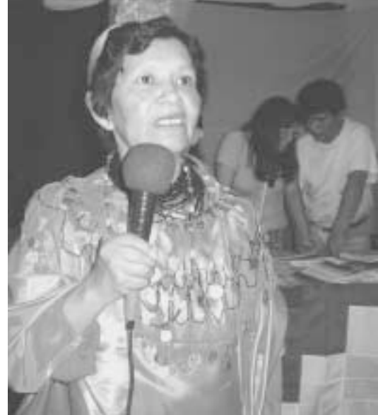
Reden vor dem Mikrophon lässt sich üben

Ausgerechnet der Siegeszug des Handys trägt zu einer erneuten Verschärfung der Konflikte um das Land in Jujuy bei. Lithium ist eine Schlüsselkomponente für moderne Informationstechnologie. Ein großer