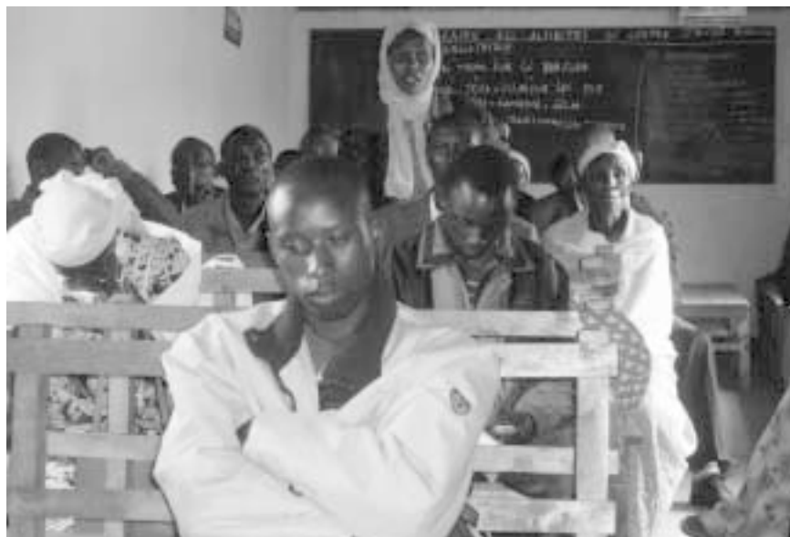
Versöhnungsarbeit, wie hier in Burundi, ist ein gemeinschaftlicher, oft schwieriger Prozess

Selbstkontrolle ist eine wichtige Voraussetzung, um nicht von Trieben wie Aggressivität und Feindseligkeit beherrscht zu werden. Nach dem Genozid in Ruanda hatten viele Witwen und Kindersoldaten keine Selbstkontrolle mehr. Es war sehr schwer und teilweise unmöglich den „Tätern“ zu vergeben. Gewaltfreiheit zu schaffen, erfordert einen Prozess des Umdenkens. Diese Kraft zu erwerben und anzuwenden erfordert lebenslanges Bemühen. In Ruanda gibt es den Versuch „Opfer“ und „Täter“ durch die traditionelle Gacaca-Gerichtsbarkeit zu versöhnen und die Konflikte konstruktiv auszutragen. Man setzt auf Überzeugung und versucht mit ausgleichenden Angeboten Verständigung anzustreben. Hier zeigen sich aber