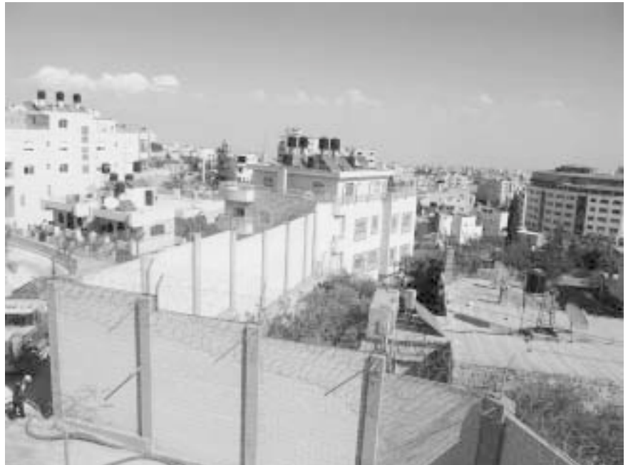
Die Israelische Mauer in Palästina zieht sich auch mitten durch Wohnviertel

Im Juli 2004 hatte der Internationale Gerichtshof für Menschenrechte den