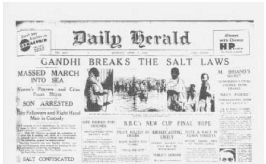
Titelseite des britischen „Daily Herald“ vom 7. April 1930: „Gandhi bricht die Salzgesetze“

Gandhi begann seine journalistische Laufbahn in London, wo er von 1888 bis 1891 Jura studierte. Schon in Indien war er bewusster Vegetarier. In London trat er einer vegetarischen Vereinigung bei und schrieb in dem Zusammen-