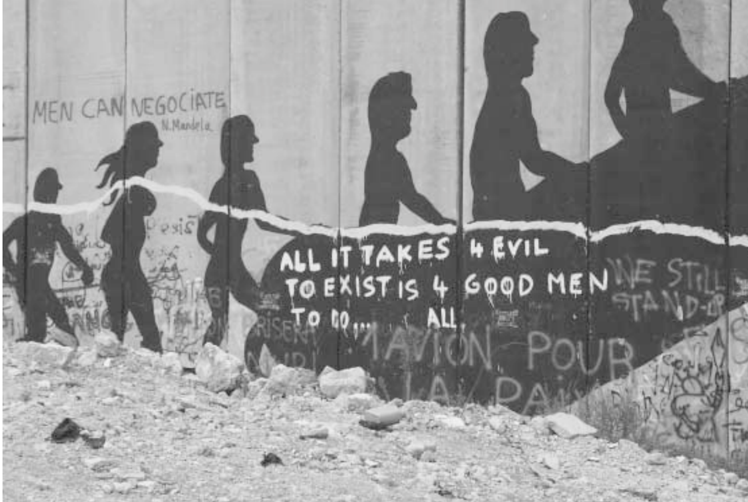
Die Israelische Mauer in Palästina – Plattform für Protest und Meinungsäußerung

brauchten lange, um uns auf unserem Weg zur Mauer aufzuhalten. Mit jeder Protestaktion konnten wir die Zerstörungsarbeiten für längere Zeit aufhalten.