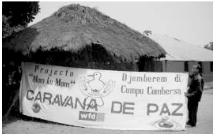
Die Djemberem dient nicht nur als Versammlungsort, sondern auch als Ausgangspunkt für Aktionen wie die „Friedenskarawane“

Ganz in der Nähe der ehemaligen Frontlinie im Stadtteil Brá, und direkt vor dem beinahe bezugsfertigen Neubau des künftigen Regierungssitzes, werden StaatsbürgerInnen mit und ohne Uniform ihren höchsten Vorgesetzten, ihren PolitikerInnen und der Öffentlichkeit gegenüber das Versprechen erneuern, die Bevölkerung von Guinea Bissau als höchsten Souverän anzuerkennen, dessen Wahlentscheidungen für alle bindend sind.