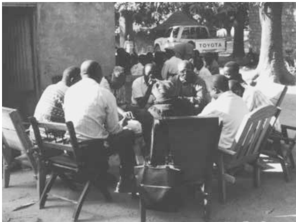
Kleine Kreise ziehen große Kreise – Entwicklung beginnt an der Basis

Galtung zeigt auf, dass es zur Durchsetzung eines „positiven“ Friedens sehr viel mehr bedarf, als allein nur die direkte Gewalt einzuschränken. Die bestehenden Verhältnisse in einer Gesellschaft, die es zulassen, dass strukturelle Gewalt geschaffen und aufrecht erhalten wird, müssen systematisch bearbeitet werden. In dieser Perspektive hat Frieden viel mit sozialer und ökonomischer Gerechtigkeit und einem demokratischen politischen Umfeld zu tun. Nach Galtung verlangt dies tiefgreifende Veränderungen für das Individuum, die Gemeinschaft und für nationale und internationale Systeme in allen ihren Aspekten. Während Anstrengungen auf allen Ebenen wichtig und notwendig sind, ist die friedensfördernde Arbeit auf individueller und gemeinschaftlicher Ebene genauso wichtig,