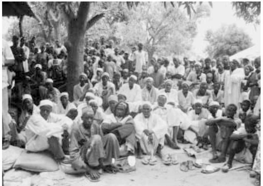
Dorfbewohner in Cumbidja, Guinea Bissau, bei der Eröffnung eines Seminars zur konstruktiven Konfliktbearbeitung

Die Frage zu beantworten, ob es Grenzen der Gewaltfreiheit und des gewaltfreien Handelns gibt, fällt mir schwer. Die Grenze für die Gewaltfreiheit im Kongo sehe ich dort, wo unschuldige Menschen, Überlebende von Massenmord und Genozid in Ruanda trotz der Anwesenheit von UN-Soldaten noch heute von den alten Tätern und Rebellen gequält und vergewaltigt werden. Viele von ihnen sterben an den Folgen von Krankheit