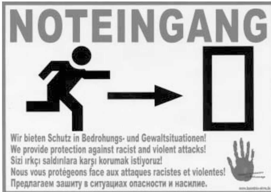
Noteingang. Dieser Aufkleber weist auf Zufluchtsorte für Opfer rassistischer Gewalt hin

„Sie da in der roten Jacke, rufen Sie die Polizei!“ - Verhaltenstipps zum Umgang mit Bedrohungssituationen