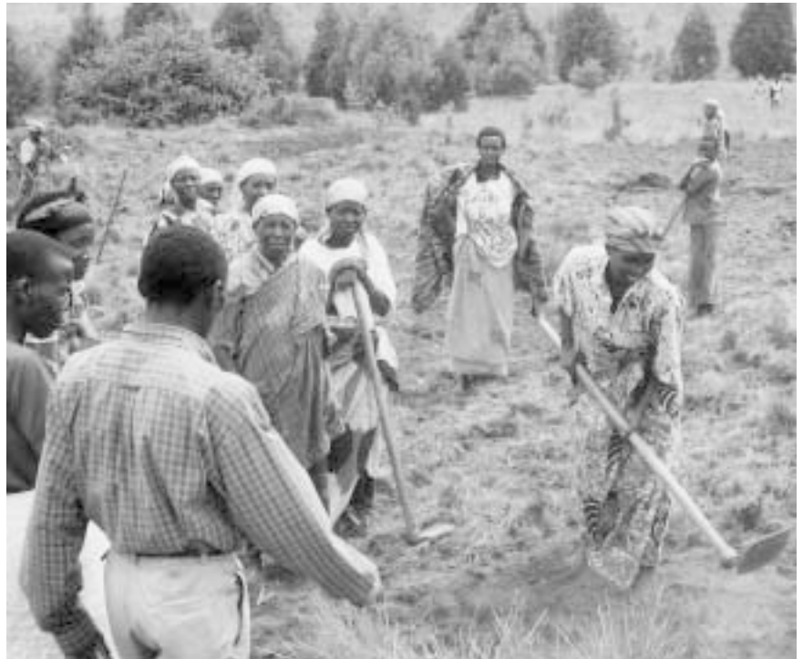
Landkonflikte lassen sich gemeinschaftlich regeln – wie hier in Burundi durch Versöhnungskomitees

Das gewaltfreie Denken ist so alt wie das Philosophieren über die beste politische Struktur einer Gesellschaft. Ghandi sagte: „Es gibt nichts Neues über die Welt zu lernen ... Wahrheit und Gewaltlosigkeit sind so alt wie die Berge.“ Die Debatte über Gewaltlosigkeit hat ihren Ursprung im Rahmen einer religiösen Lehre, die den Fokus auf die Befriedigung der spirituellen Bedürfnisse jedes Einzelnen legt. Nach dieser Lehre ist das individuelle Wohlbefinden die Voraussetzung zur Entfaltung einer harmonischen Gesellschaft. Gewaltloser Widerstand wird in diesem Kontext als eine friedliche Maßnahme gegen bestehende Ungerechtigkeiten verstanden und rührt aus der tiefen Überzeugung her, dass durch Gewalt keine Gerechtigkeit entstehen kann.