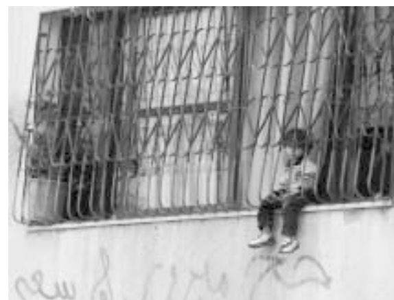
Schnappschuss aus Palästina